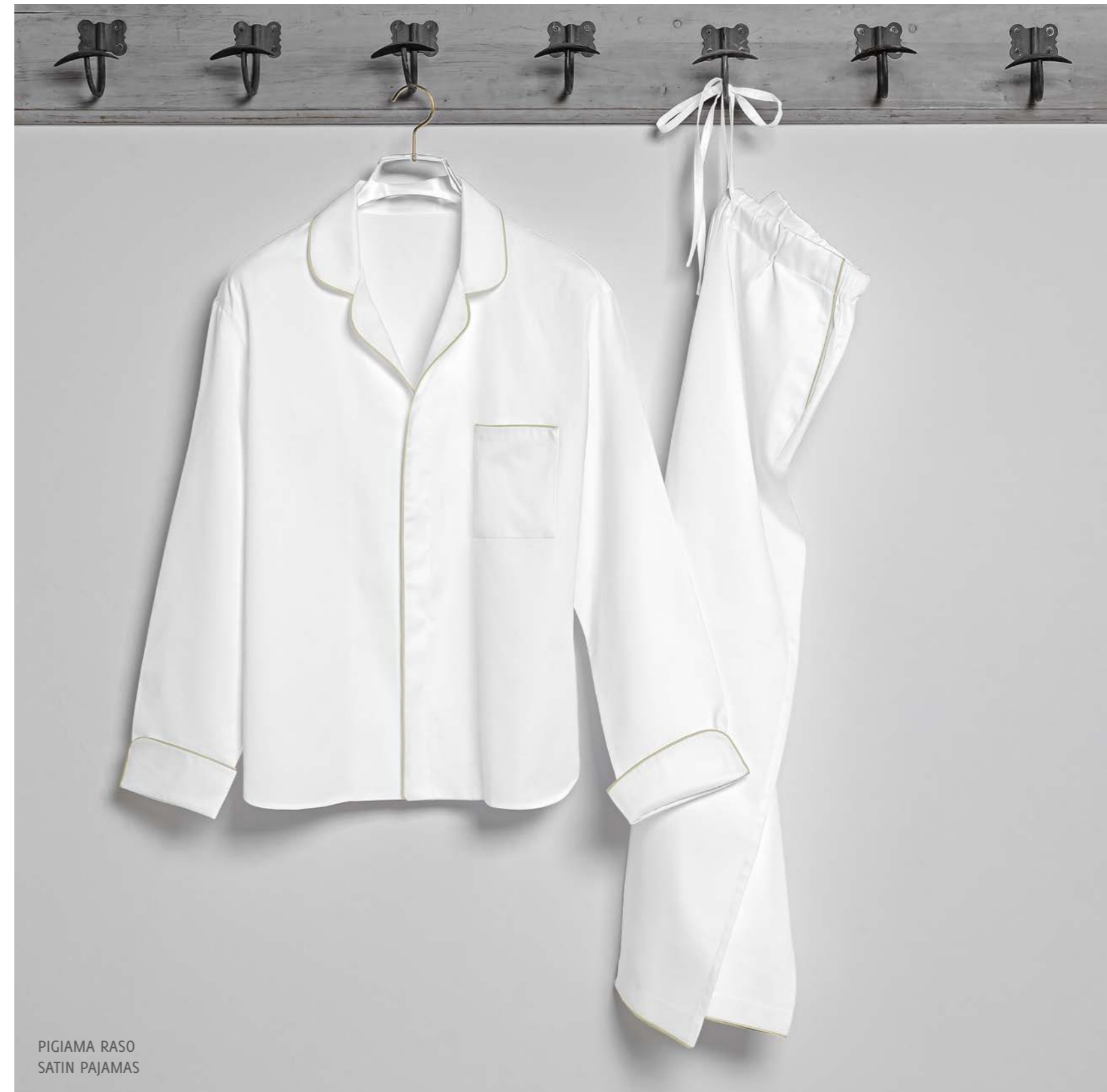
PIGIAMA RASO SATIN PAJAMAS

IN A WARM, PERFUMED ATMOSPHERE, WE ARE WRAPPED AND DRIED BY TAILORED BATHROBES, HAND-CUT AND HAND-SEWN LIKE ELEGANT DRESSES.