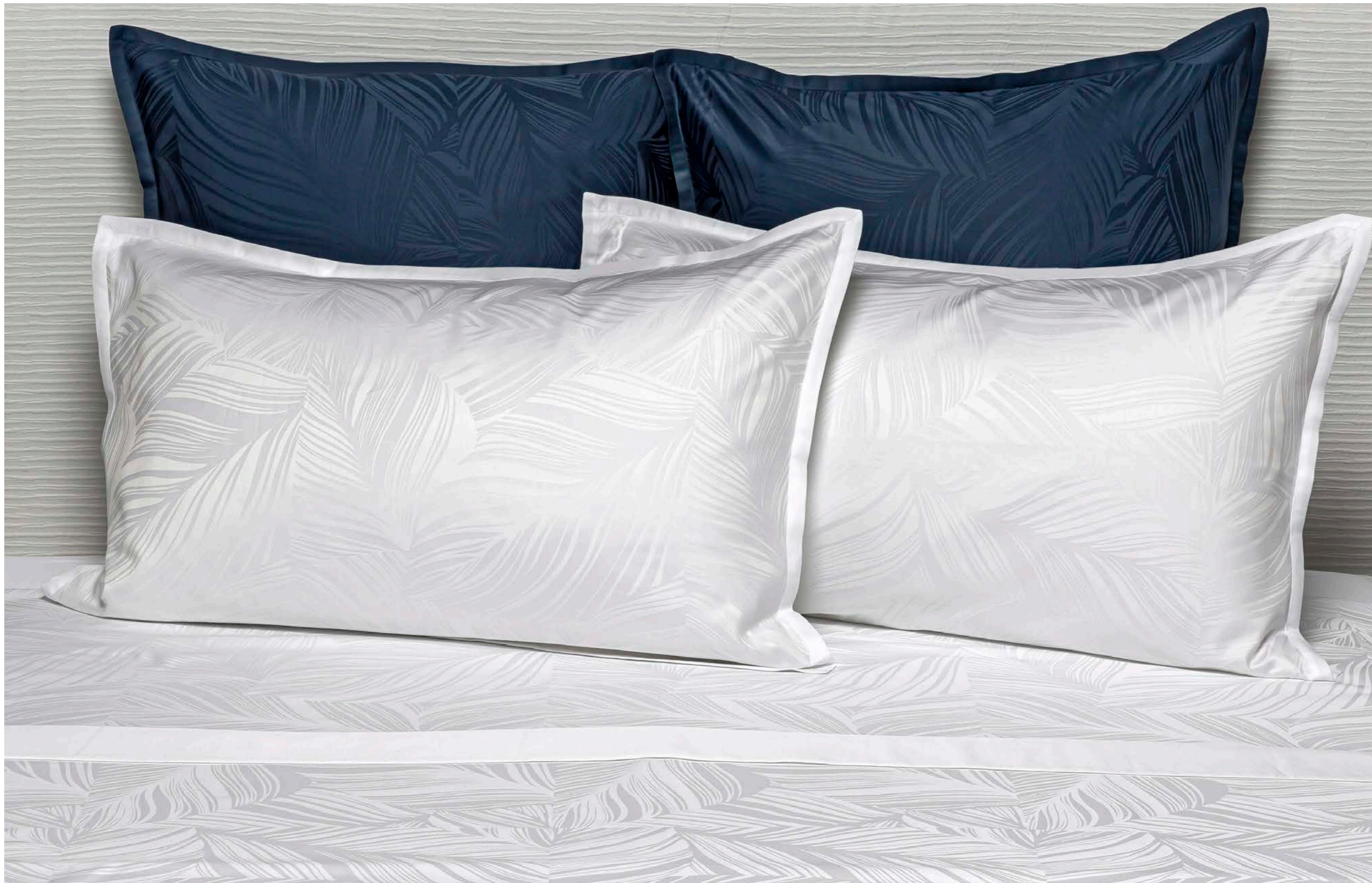
COMPLETO LETTO HAMBURY SHEET SET HAMBURY