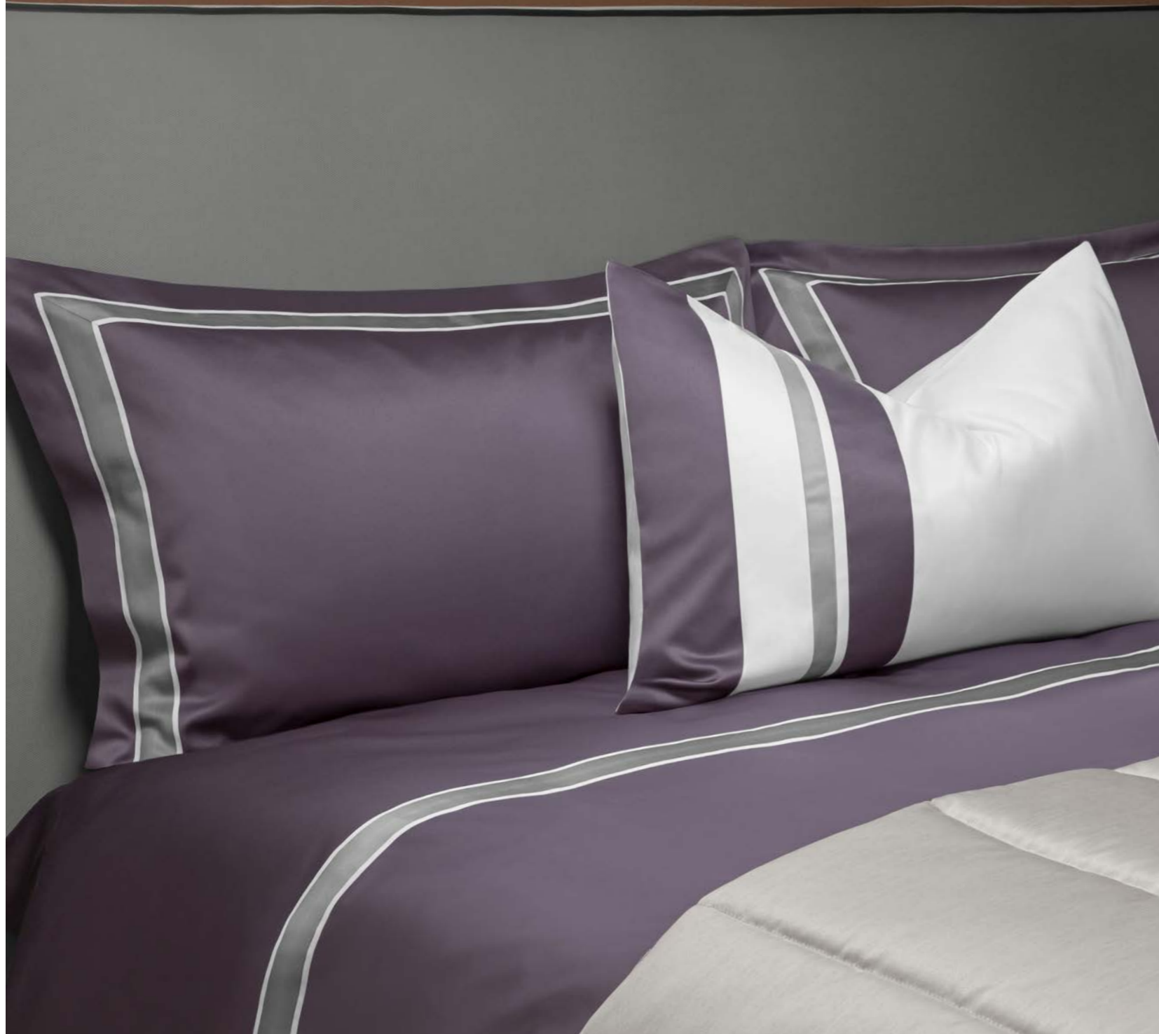
COMPLETO LETTO KENSIGTON SHEET SET KENSIGTON