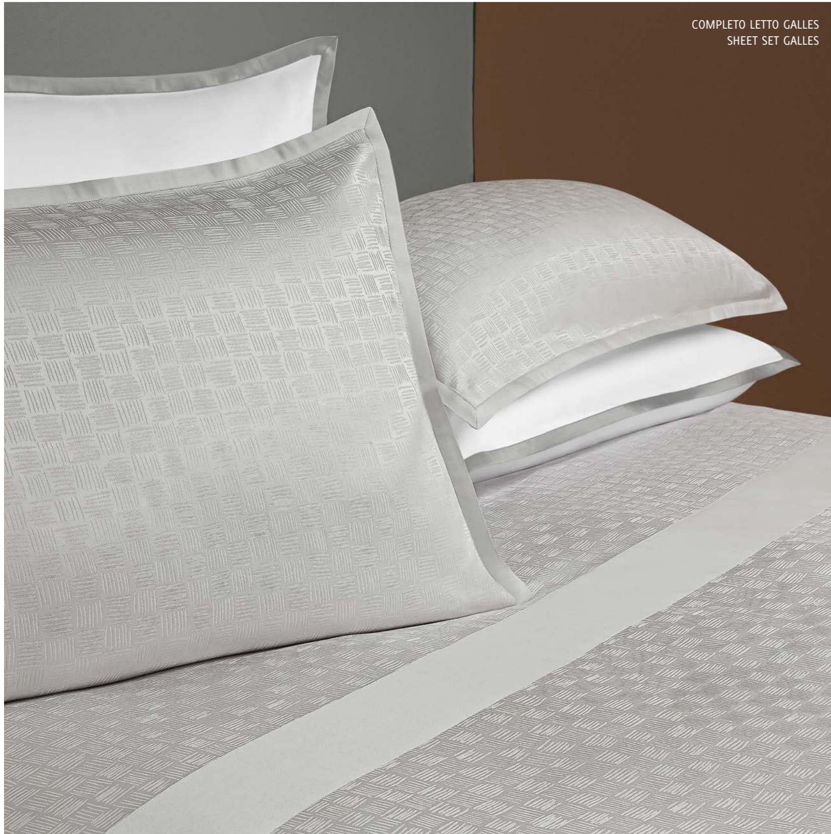
COMPLETO LETTO GALLES SHEET SET GALLES