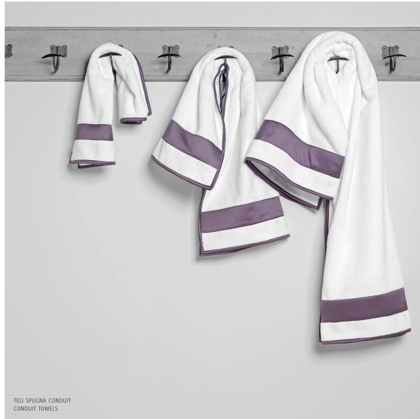
TELI SPUGNA CONDUIT CONDUIT TOWELS