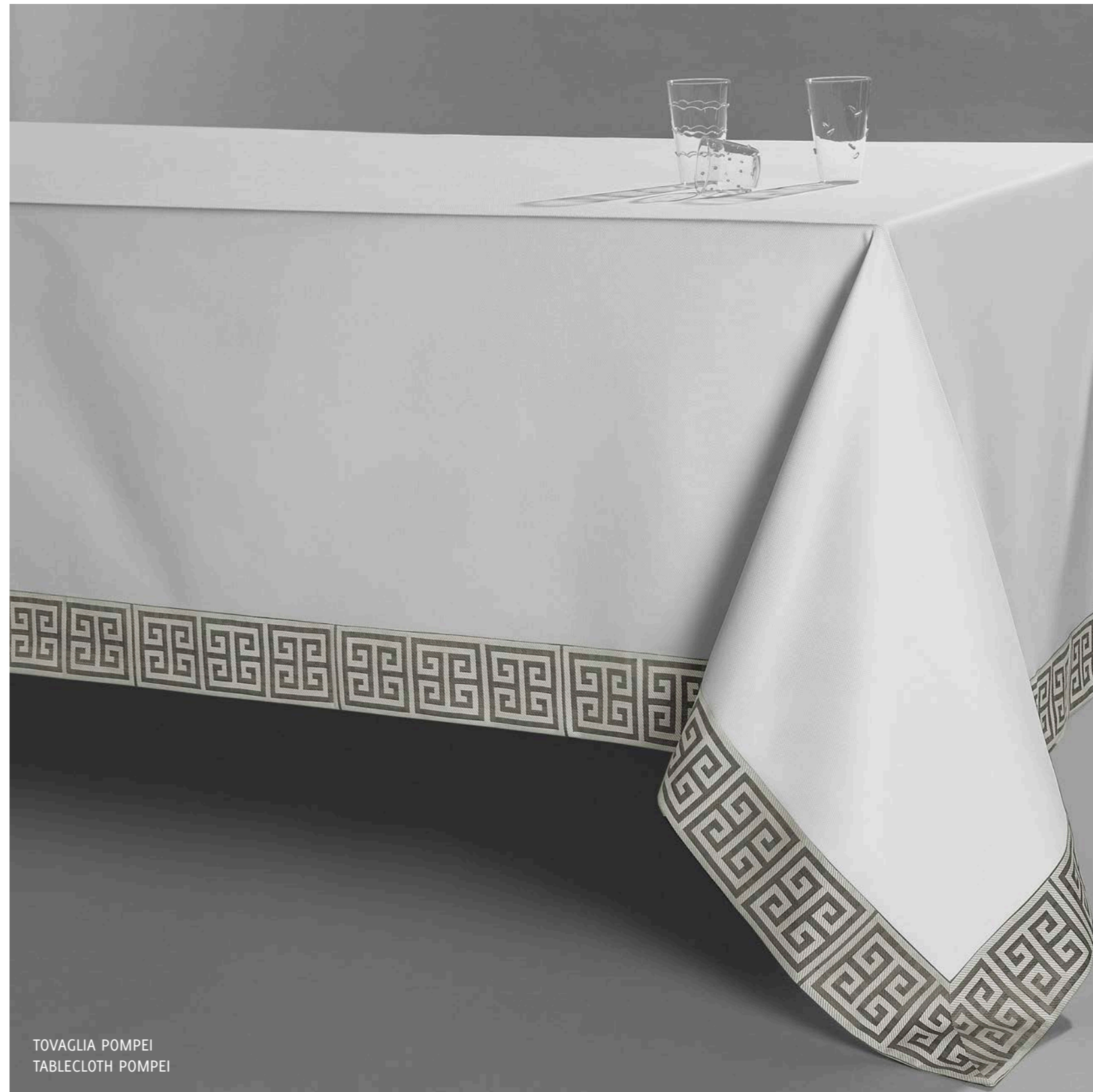
TOVAGLIA POMPEI TABLECLOTH POMPEI