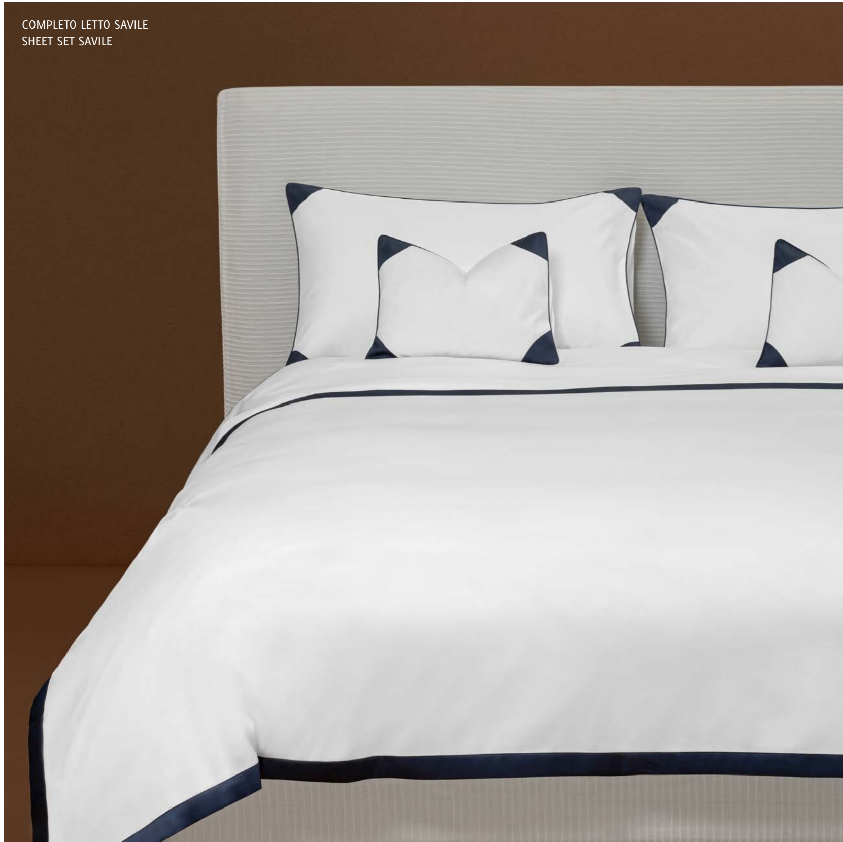
COMPLETO LETTO SAVILE SHEET SET SAVILE