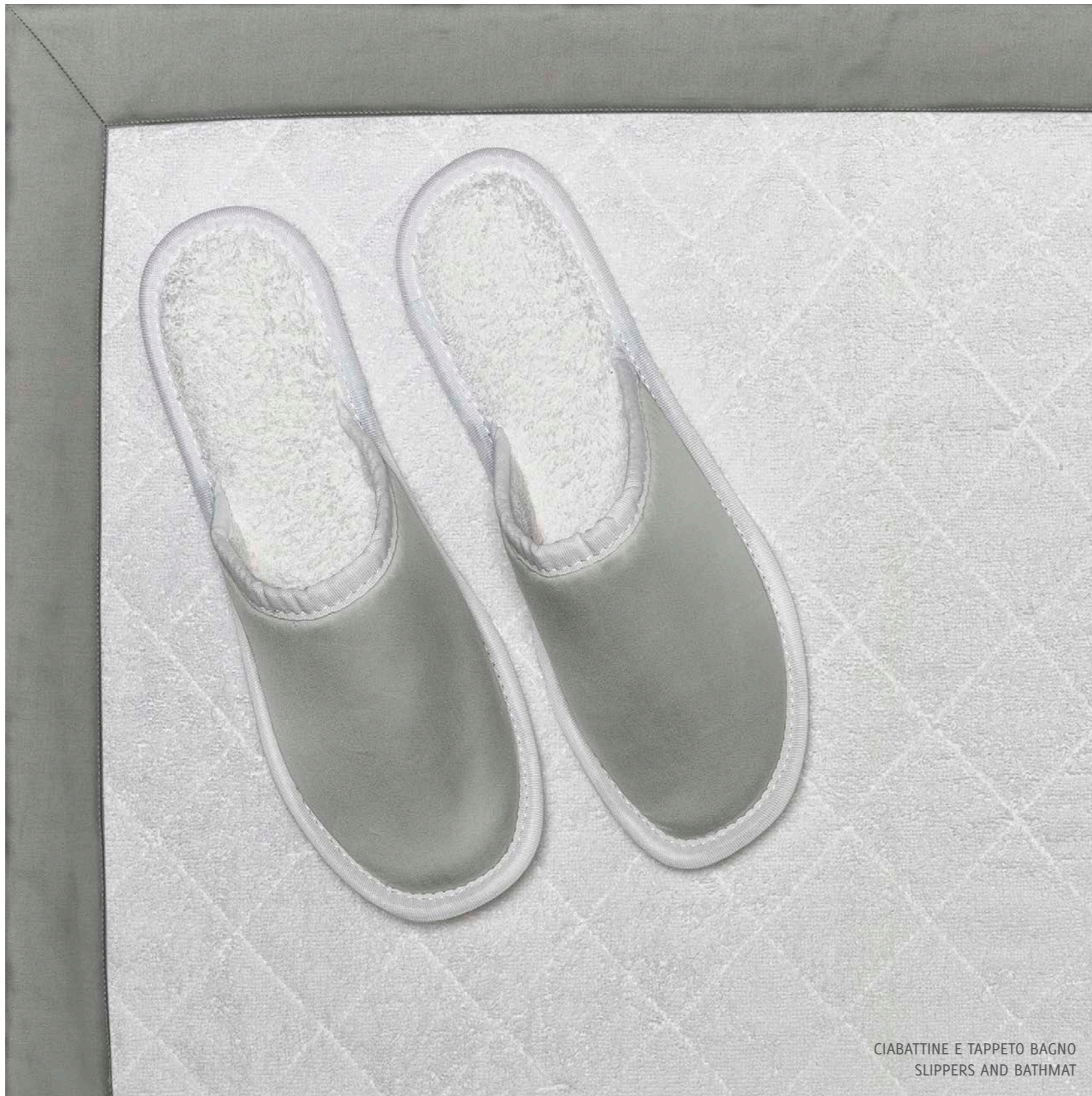
CIABATTINE E TAPPETO BAGNO SLIPPERS AND BATHMAT