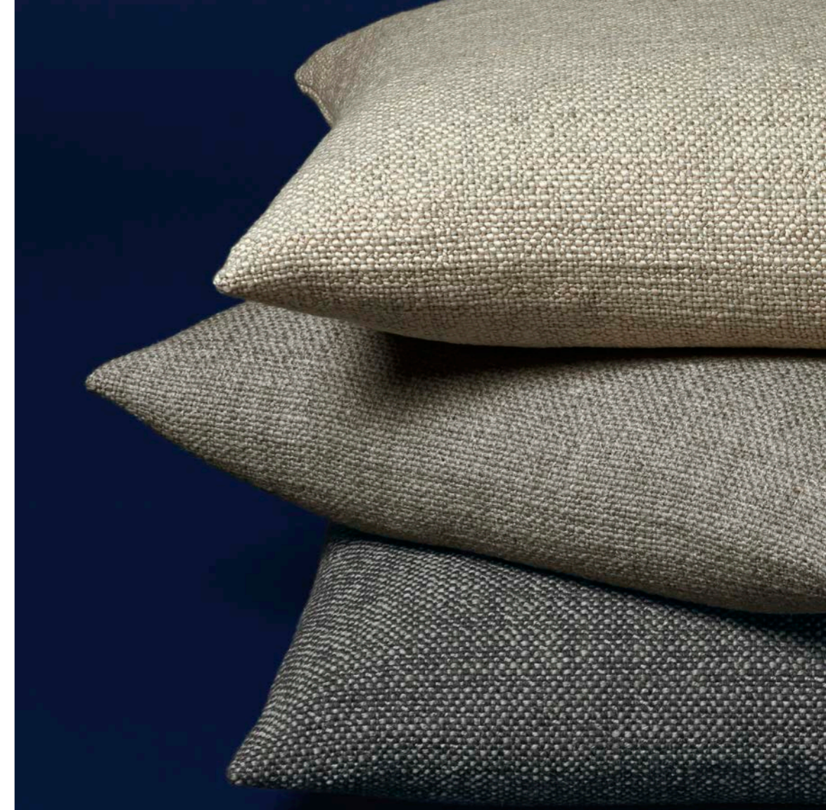
CUSCINI AUCKLAND AUCKLAND PILLOWS