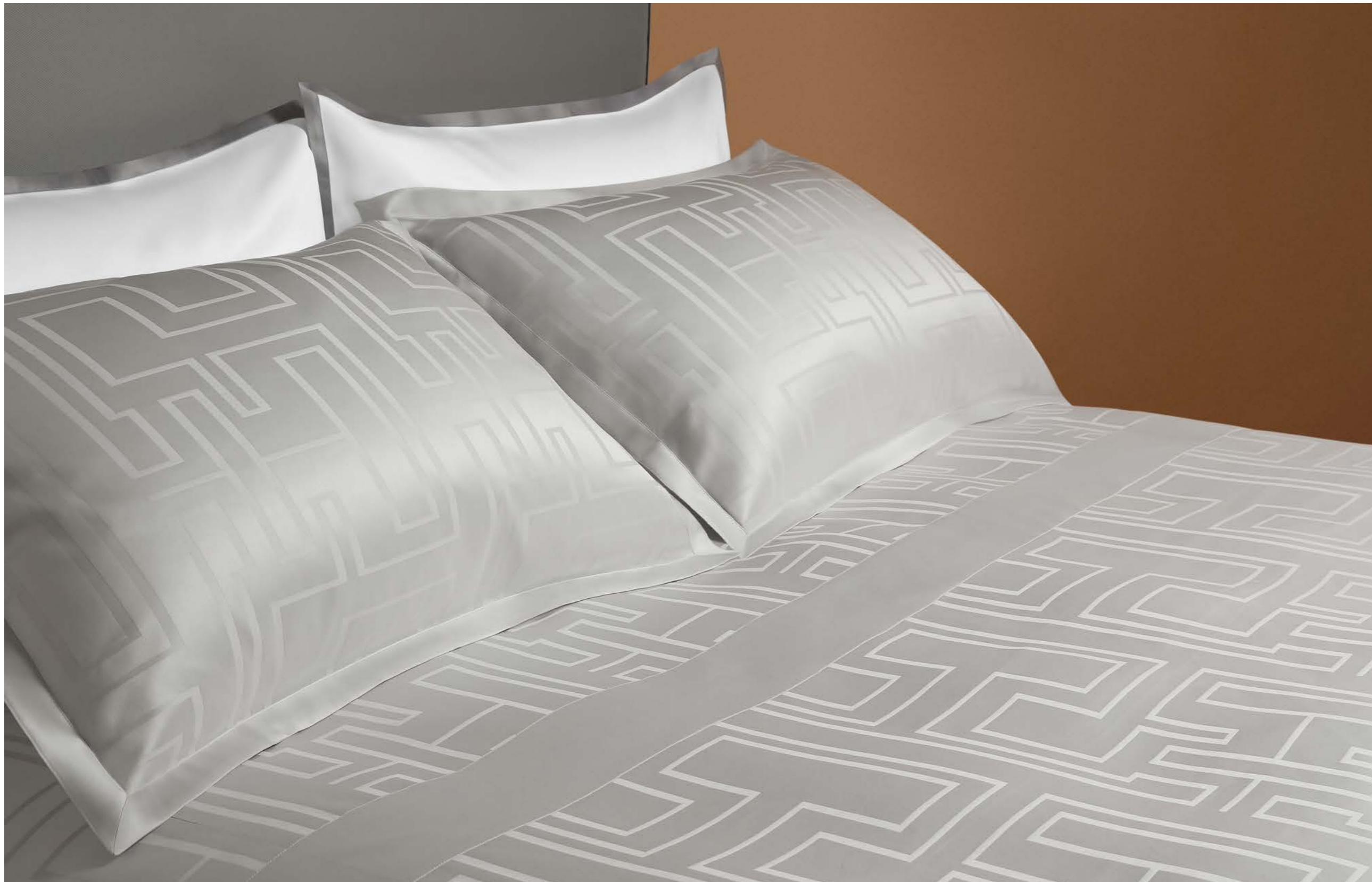
COMPLETO LETTO ARIANNA SHEET SET ARIANNA