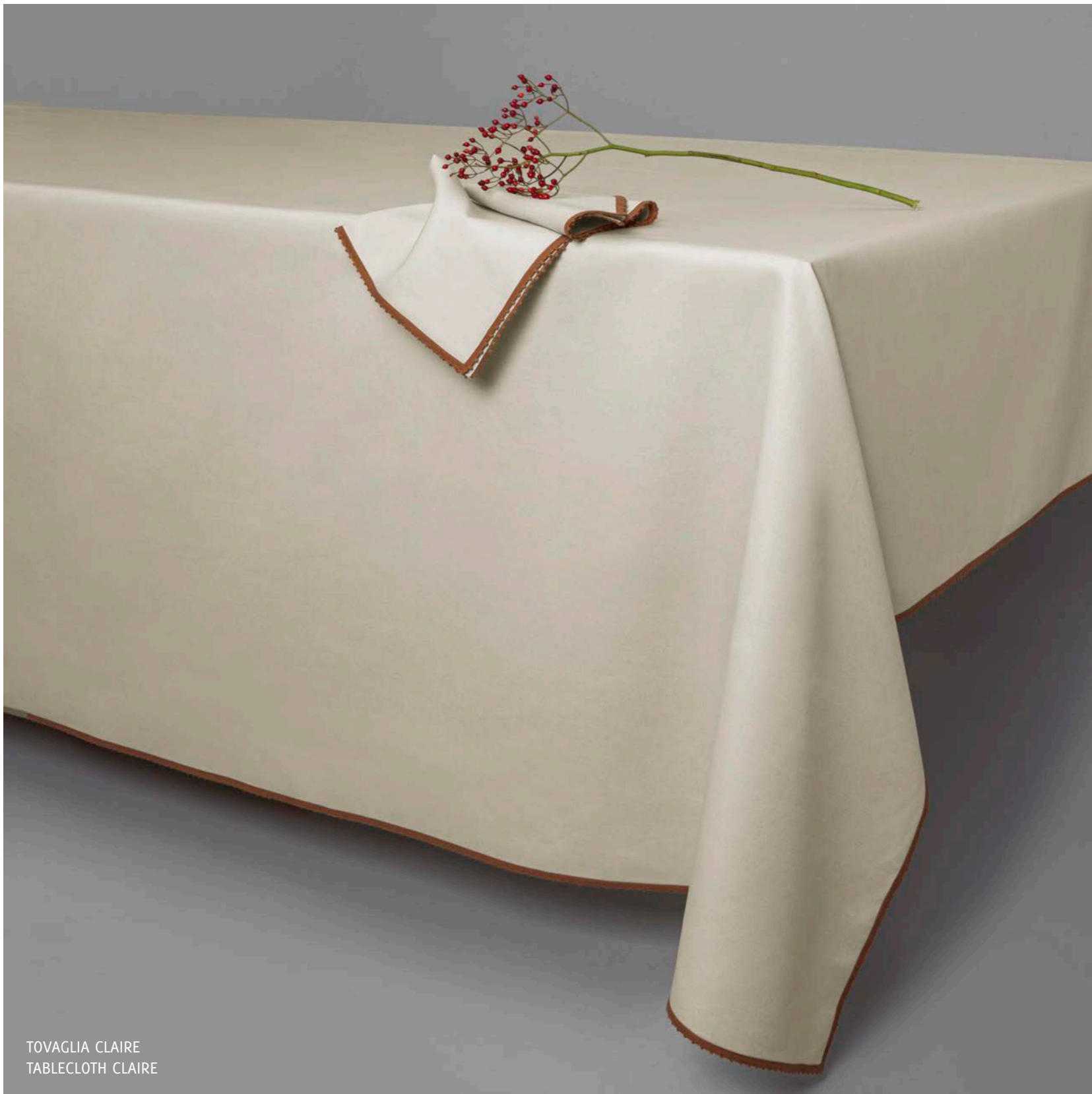
TOVAGLIA CLAIRE TABLECLOTH CLAIRE