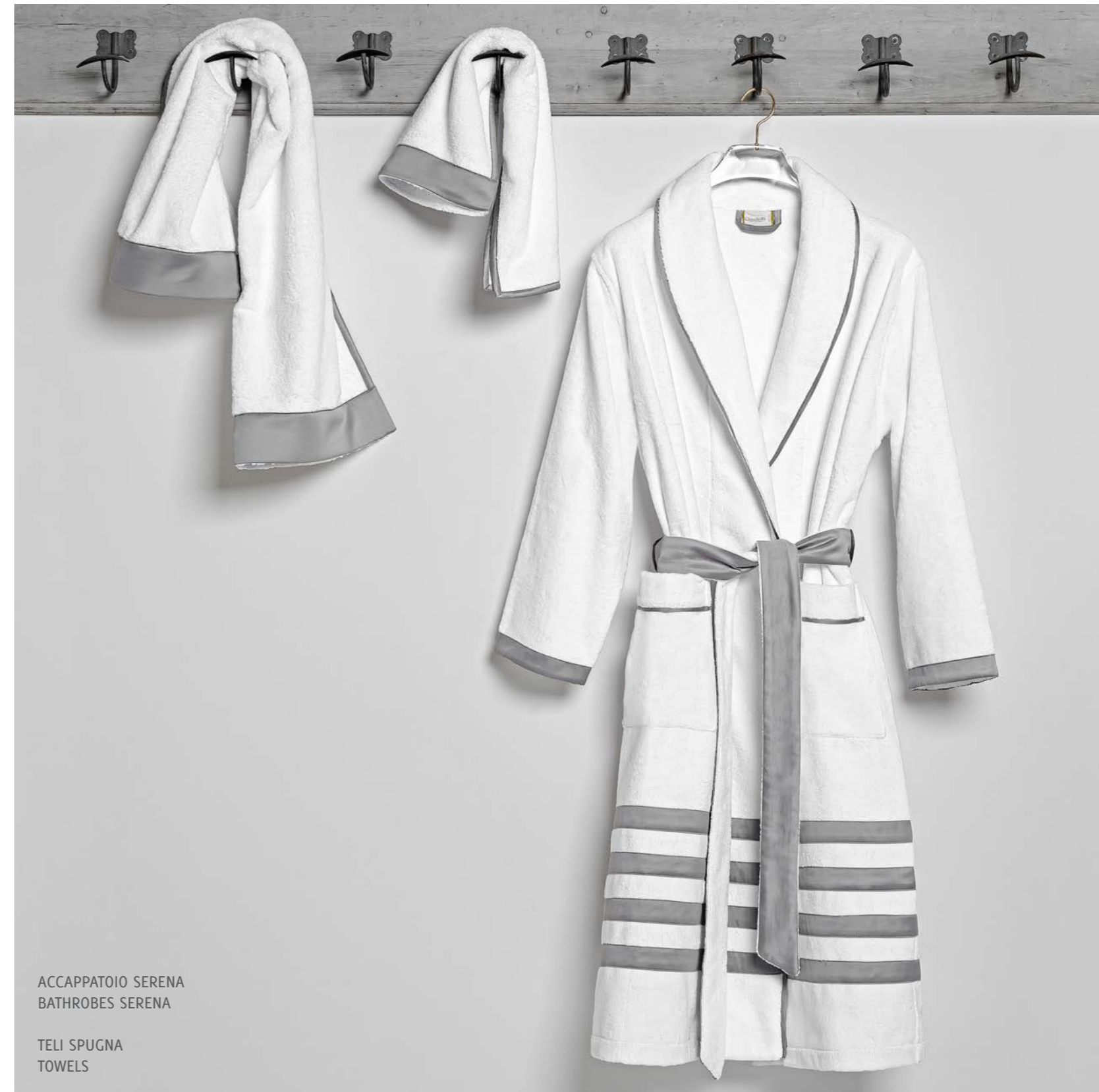
ACCAPPATOIO SERENA BATHROBES SERENA