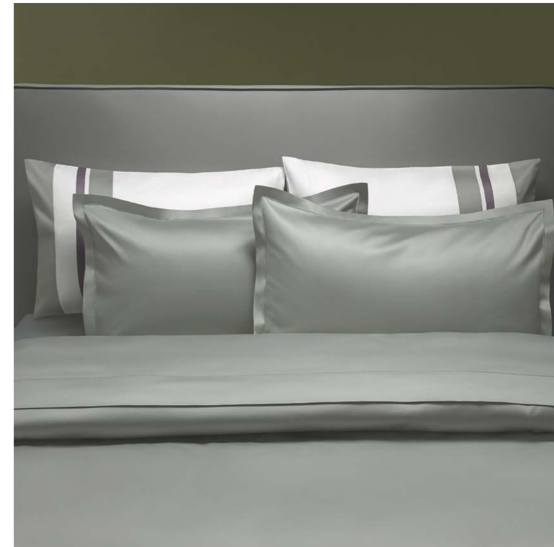
COMPLETO LETTO RASO/BELLAGIO SHEET RASO/BELLAGIO