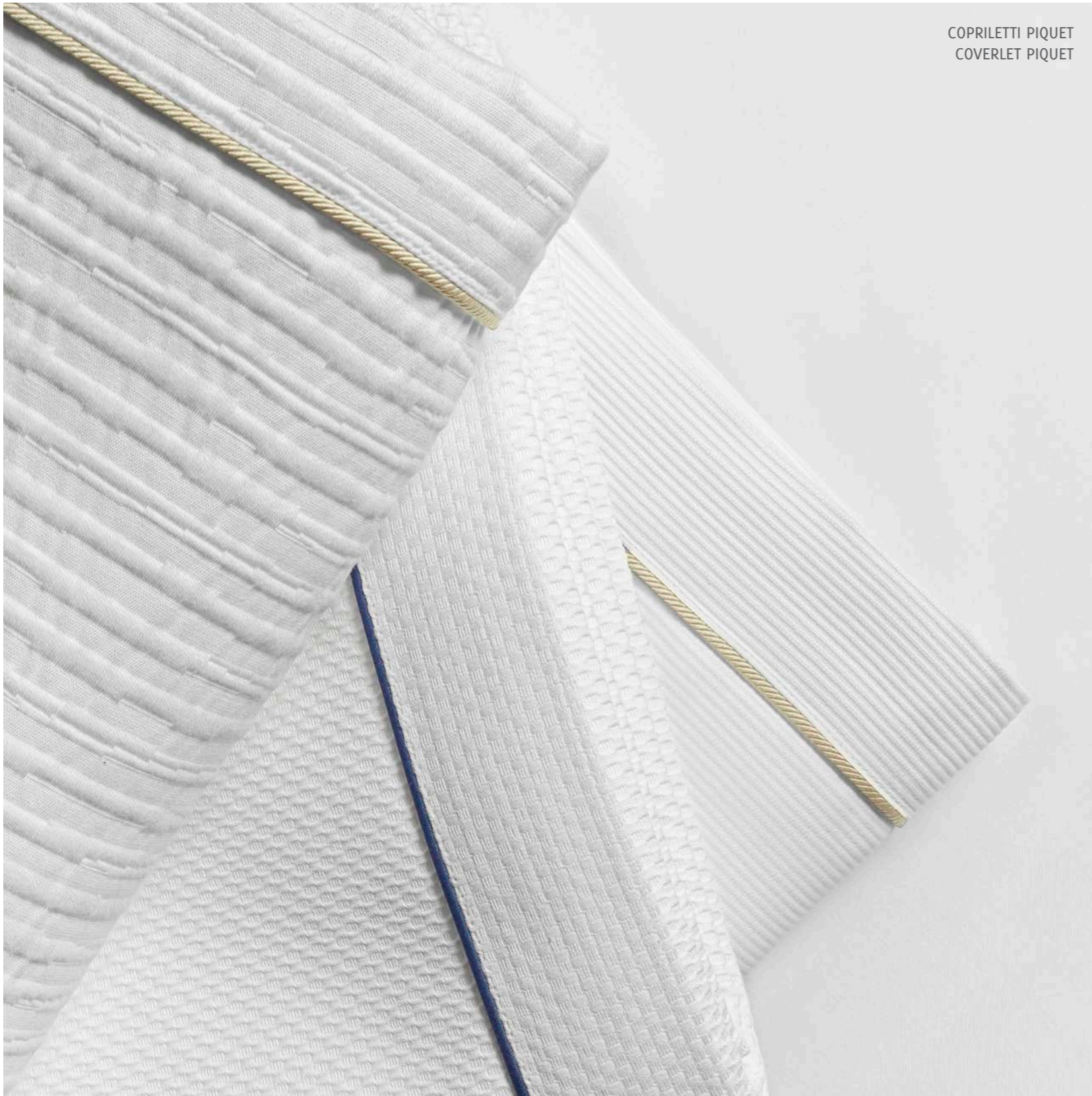
COPRILETTI PIQUET COVERLET PIQUET