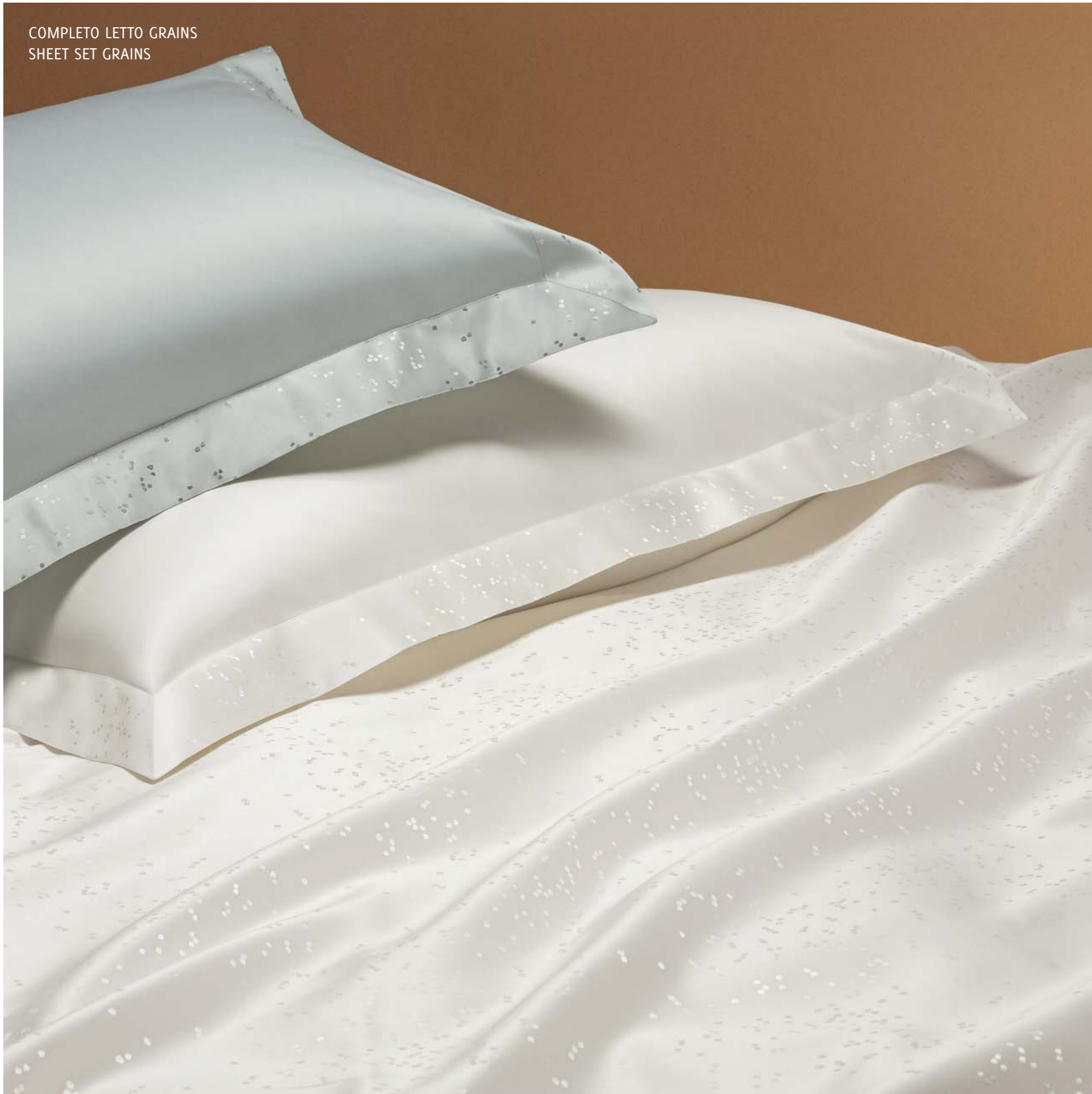
COMPLETO LETTO GRAINS SHEET SET GRAINS