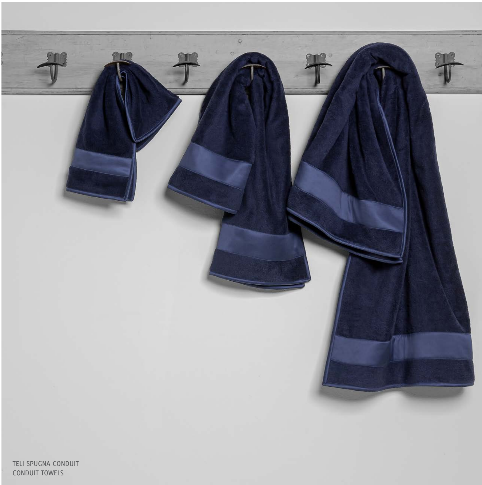
TELI SPUGNA CONDUIT CONDUIT TOWELS