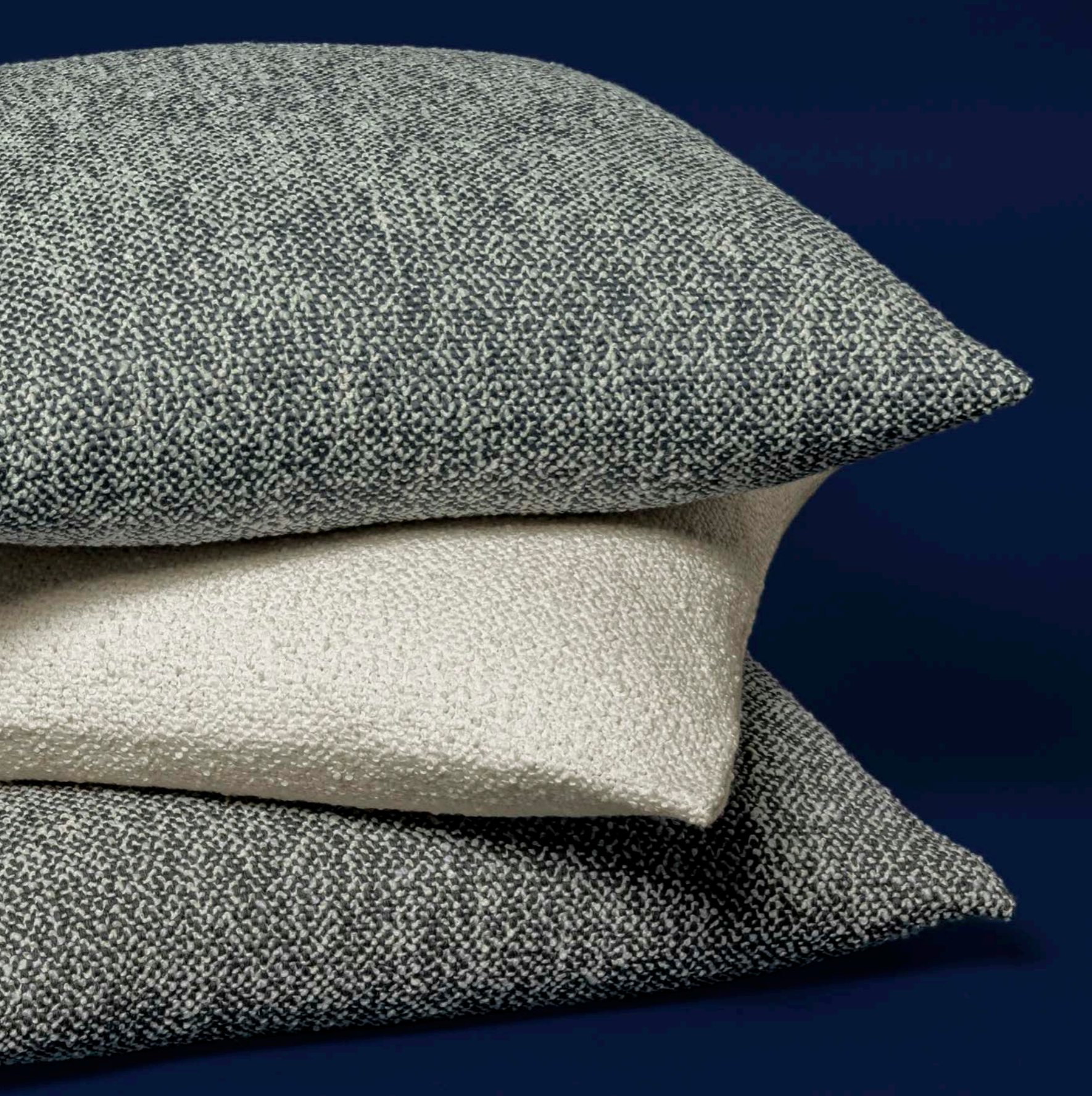
CUSCINI PERTH PERTH PILLOWS