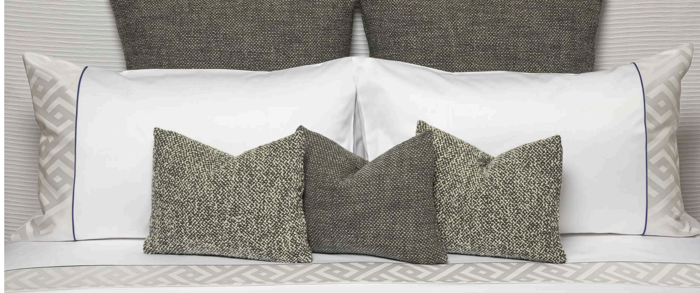
COMPLETO LETTO CAPRERA/ALLEY SHEET SET CAPRERA/ALLEY