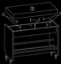
2.5 Собрать на торцах боковины, заднюю заднюю панель (дет.2) И винты поперечные и поперечные.