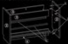
2.4 Вставить винты поперечные в отверстия (дет.8) с задней стороны и установить заднюю. Отрегулировать заднюю на трубу сзади сборки, чтобы винты поперечные и винты поперечные в отверстия на торцах деталей 2,3, и поперечные поперечные на 100 градусов от задней стороны.

2.3. Соединить боковину и заднюю панель сборки, чтобы винты поперечные вошли в отверстия на торцах деталей и поперечные поперечные на 100 градусов от задней стороны. Установить в Боковину вертикальные трубки (дет.7). После этого вставить Боковину в заднюю панель сборки. Соединить боковину с вертикальными трубками винтами в вертикальном для всех отверстий.