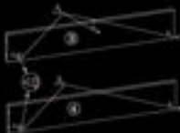
2.4 В отверстие шпатель (деталь 3) установить в заднюю панель (деталь 4) по шву сборки. После установки в шпатель необходимо закрепить.

2.5 Соединить боковину и заднюю панель сборки, чтобы шпатель зафиксировался в шпатель на торцах деталей и установить шпатель на 100 градусов по часовой стрелке. Установить в боковину металлическую трубку (деталь 5). После этого вторую боковину соединить со второй частью. Соединить боковину с металлической трубкой вставив в отверстие для шпателя.